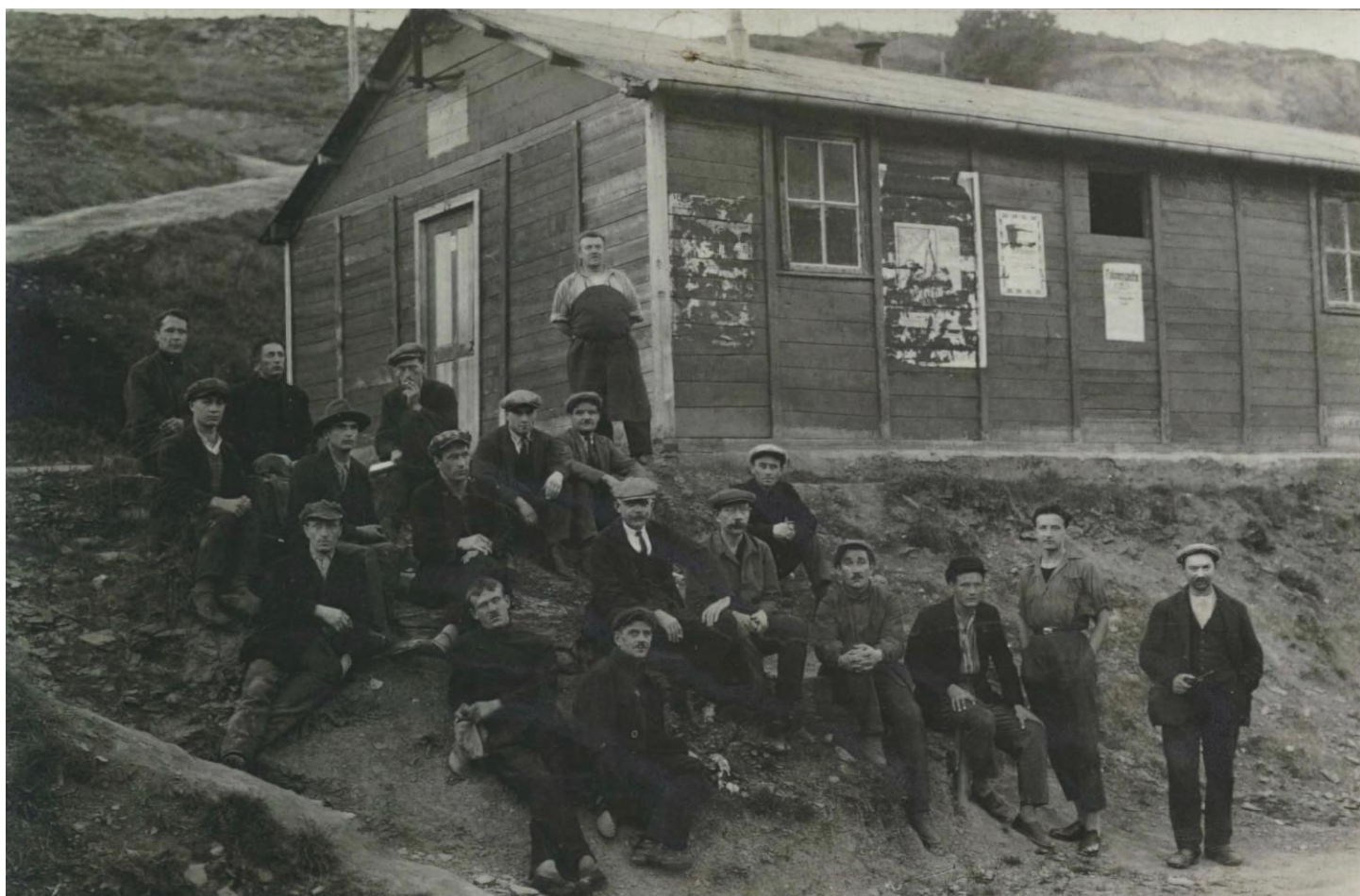
«Русская временка» и ее обитатели. Конец 1920-х – начало 1930-х.

Уже через два года в Бельгию уехали первые двадцать человек, а пятеро из них даже поступили в университет в бельгийском Левене. В основном это были кадеты, кого детьми и подростками эвакуировали из Крыма в составе целых училищ, как, например, Донской кадетский корпус, или кто уже учился в университете Софии или Белграда. По прошествии еще пары лет, в 1931г., в Вильтце было зарегистрировано девяносто три русских, представляющих вторую по величине диаспору населенного пункта (их опережали немцы с перевесом более чем в три раза). Однако спустя еще четыре года в Вильтце зарегистрировано лишь сорок шесть русских по причине массового отъезда бывших белогвардейцев в Парагвай.