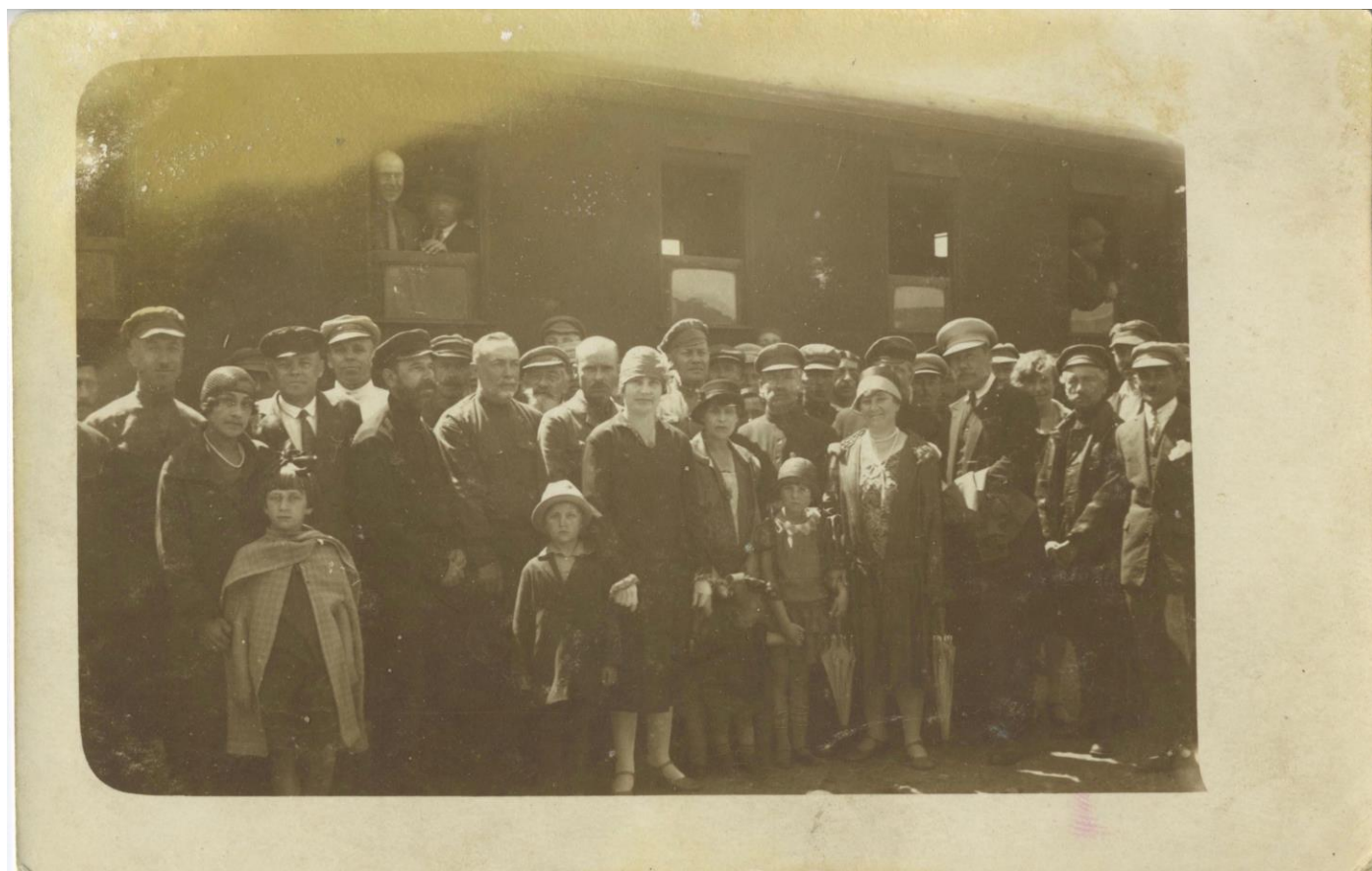
Люксембург, 1928. Прибытие партии русских рабочих из Болгарии.